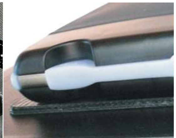
Rutsch- u. Vibrationsdämpfer z. B. für externe Festplatten

Diese Haftfolie mit Verstärkung aus Glasfasergewebe fixiert Teile auf allen glatten und leicht rauen Oberflächen, auch in extremen Schräglagen oder senkrecht an Wänden - fast schon "magnetisch"! Optimal z.B. für die Fixierung von Bauteilen bei Reparaturarbeiten, Montagehilfe, Anti-Rutsch-Matte für Mobiltelefone, Sonnenbrillen im Auto, Haftfläche für Notizen und Kleinteile am Kühlschrank usw. Die ungiftige Folie garantiert beste Haftung ohne Klebstoffe sowie eine extrem lange Lebensdauer. Zusätzlich kann sie in einem sehr großen Temperatur-Einsatzbereich verwendet werden.