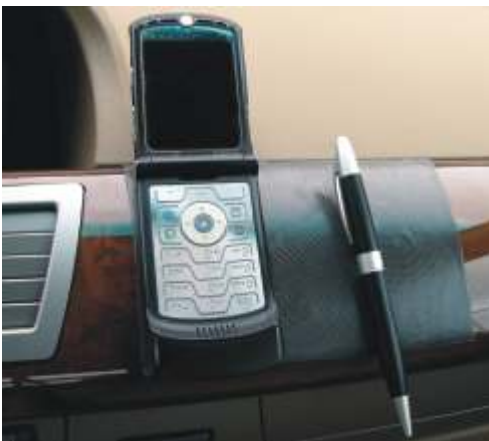
Antirutschmatte im Auto